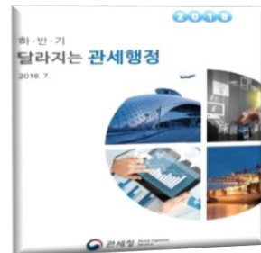
▲ 출처: 관세청 / 상세자료별첨